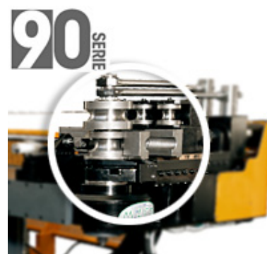
Curvadora de tubo Serie 90: